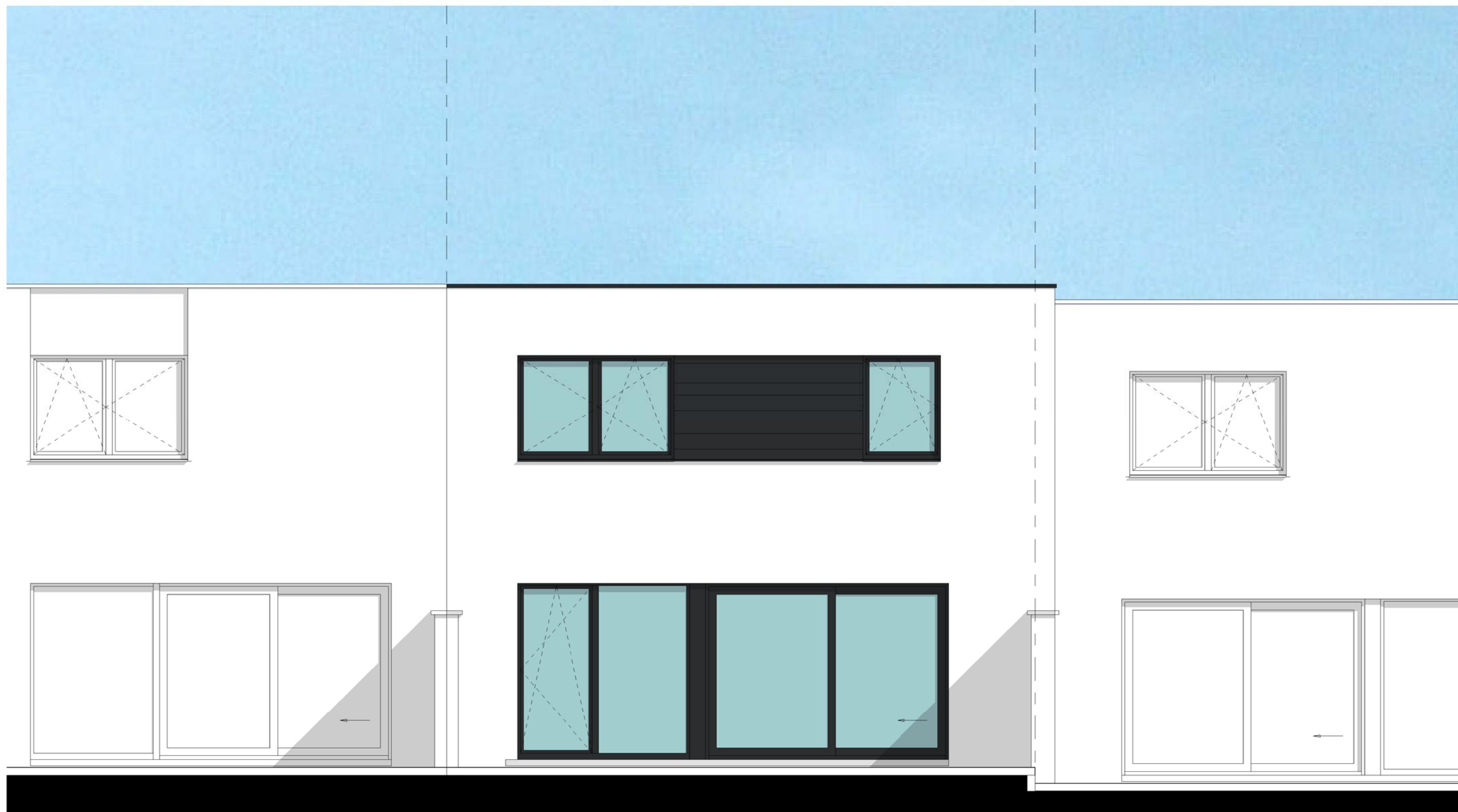
ACHTERGEVEL LOT 3