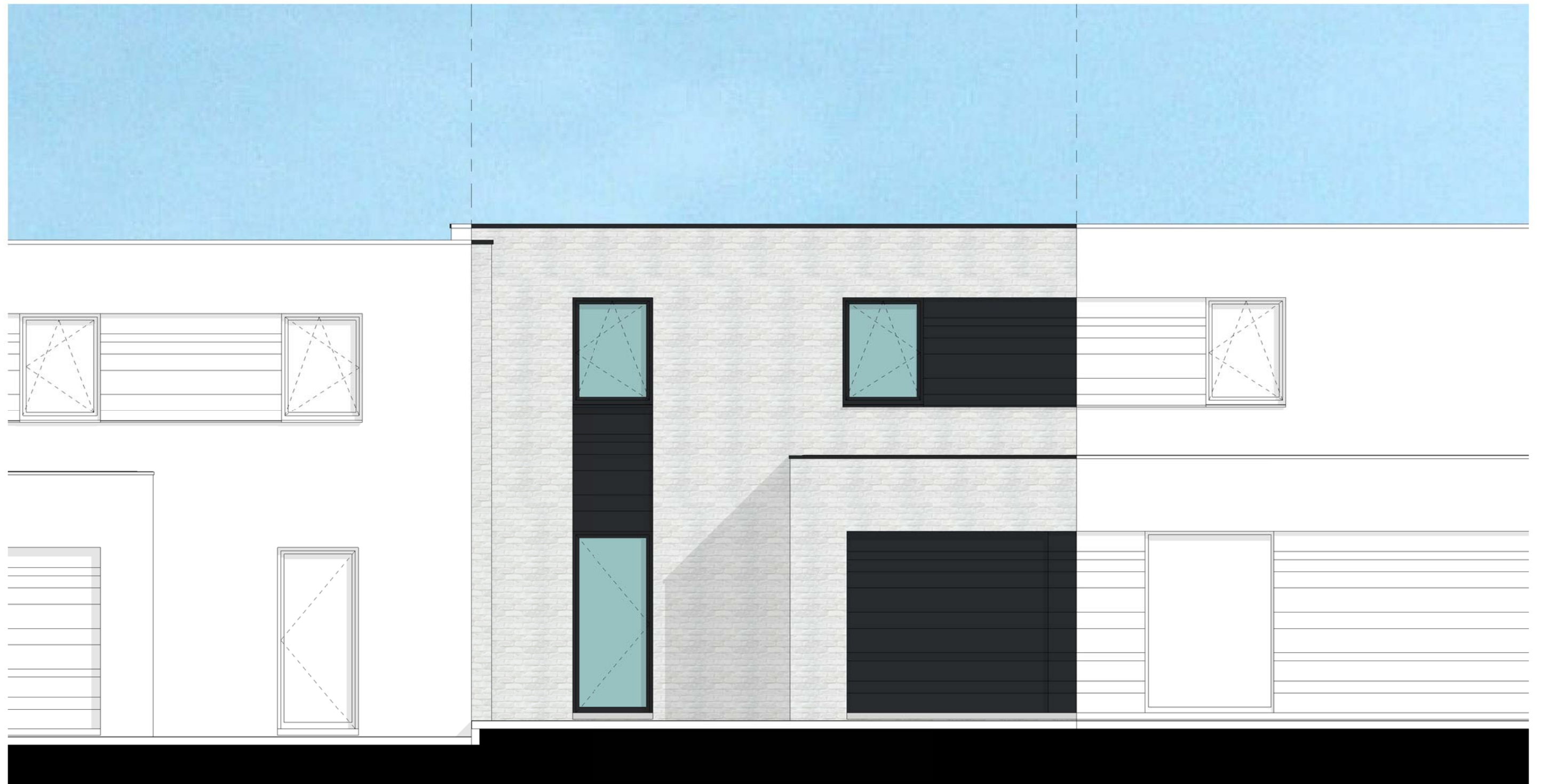
VOORGEVEL LOT 3