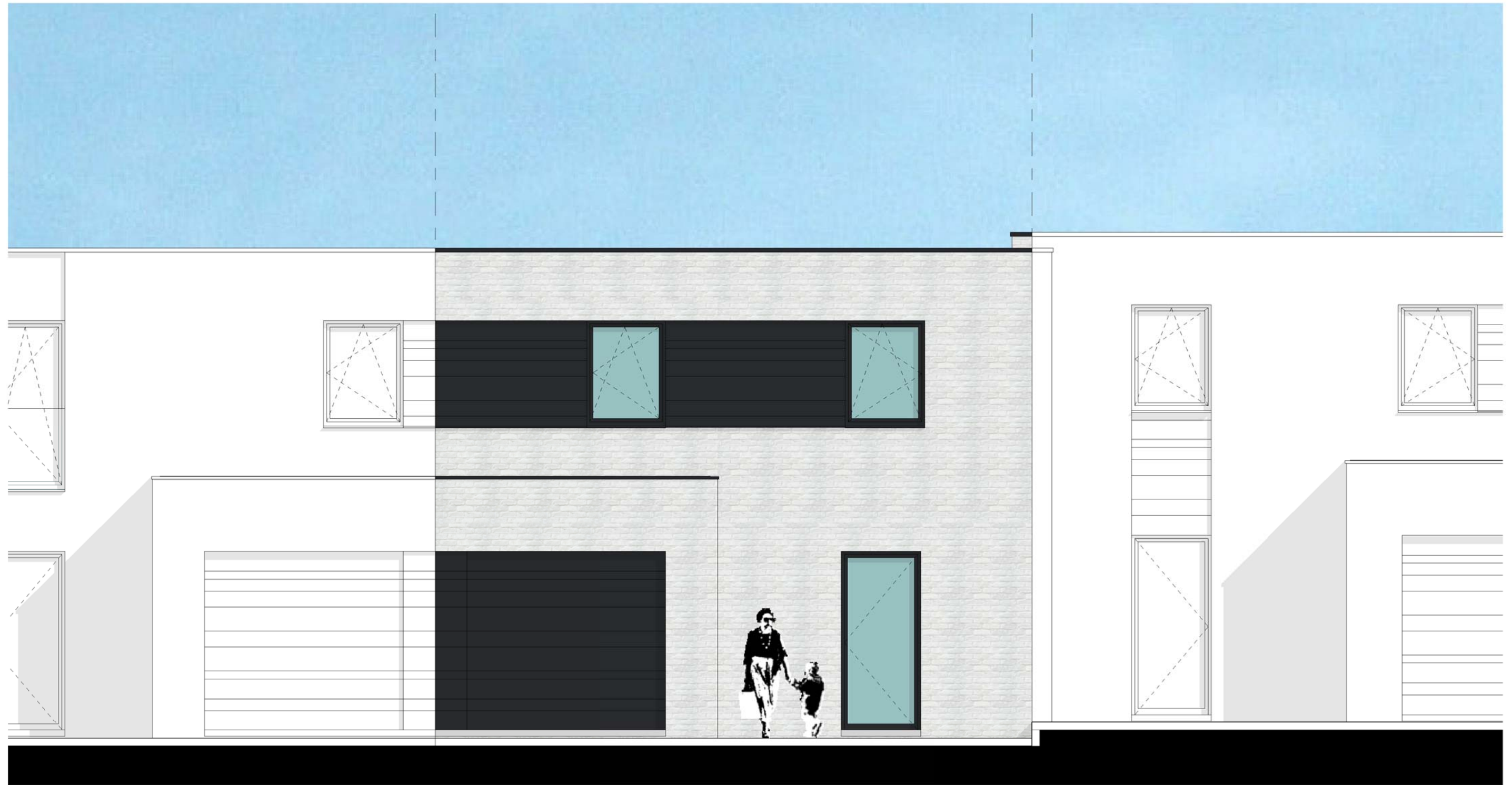
VOORGEVEL LOT 2