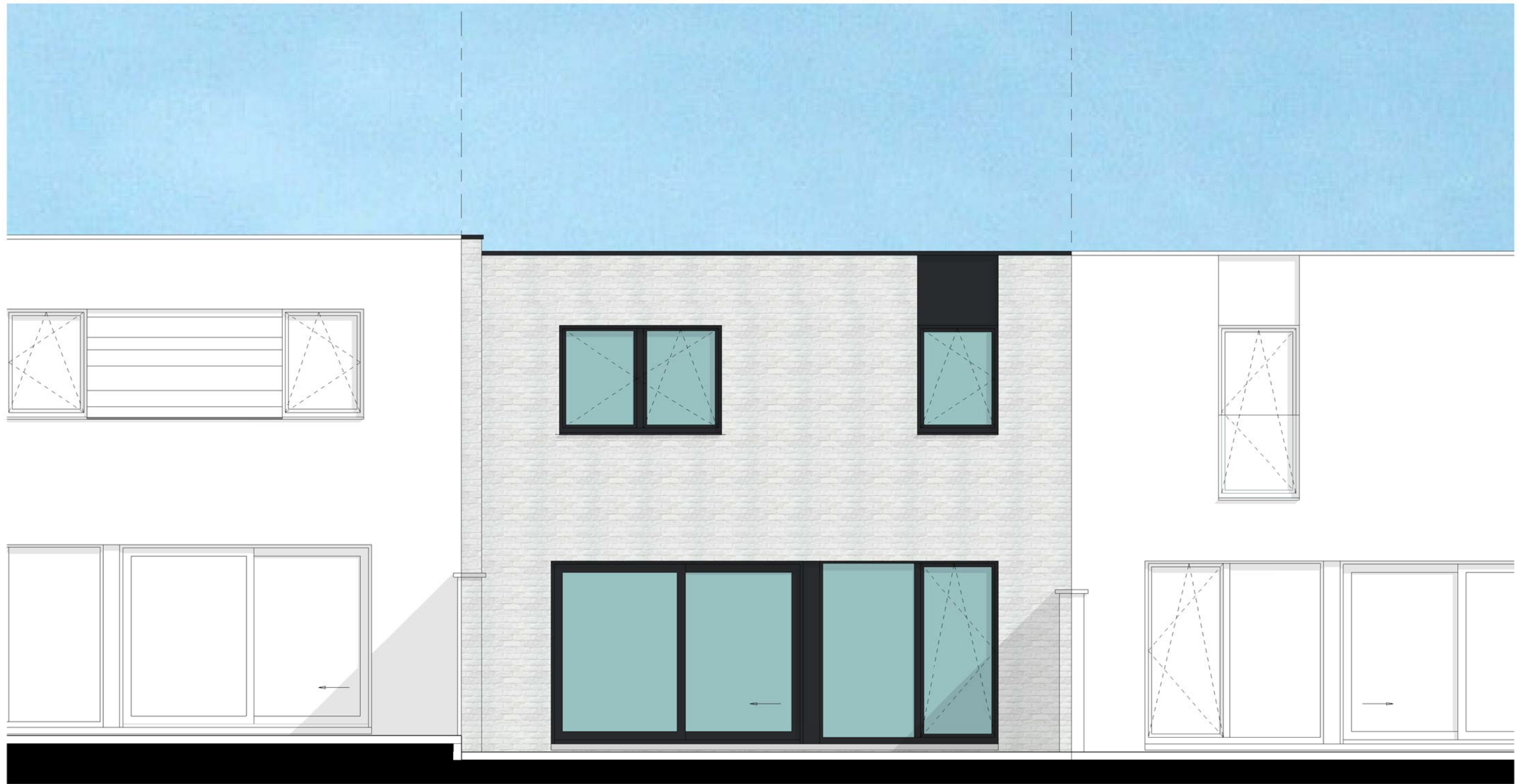
ACHTERGEVEL LOT 2